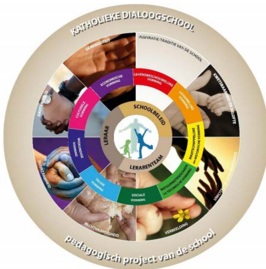
Figuur 1: Wegwijzers voor schoolbeleid

Waarom zou je voor zorgbreed en kansrijk onderwijs gaan? Zit het in het DNA van je school? Als dat zo is, hoe komt dat dan? Of is het eerder je persoonlijke 'drive' die je motiveert om er elke dag voor te gaan? Om je te helpen die moeilijke vragen te beantwoorden, creëerden we voor jou acht wegwijzers. Ze zijn bedoeld als inspiratiebron voor jou en je collega's en hebben sterke raakpunten met de Bijbel en de Bijbelse 'drive' om voor goed onderwijs te zorgen.